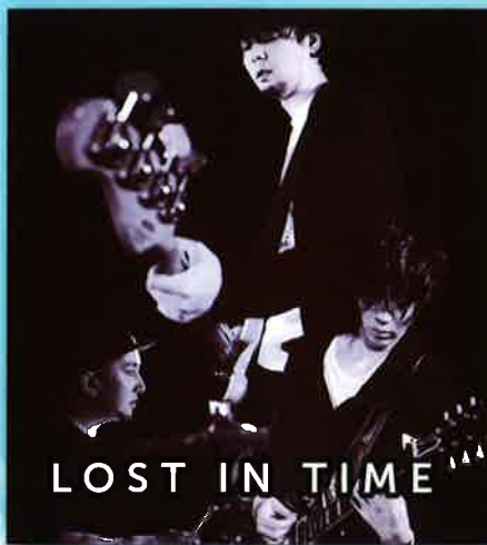
LOST IN TIME